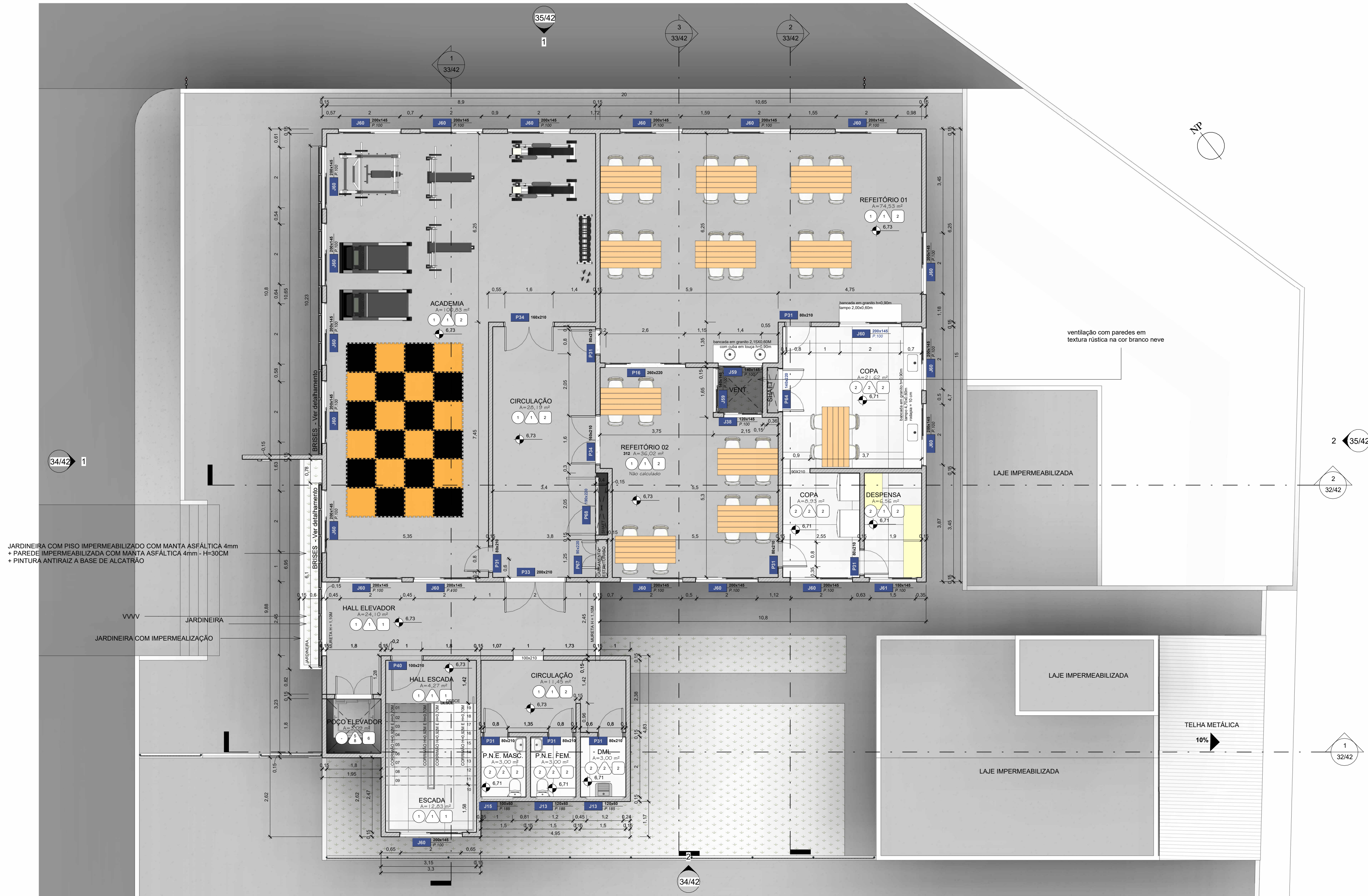
1 BPCAATINGA - PLANTA BAIXA - 2º ANDAR ESCALA 1 : 75